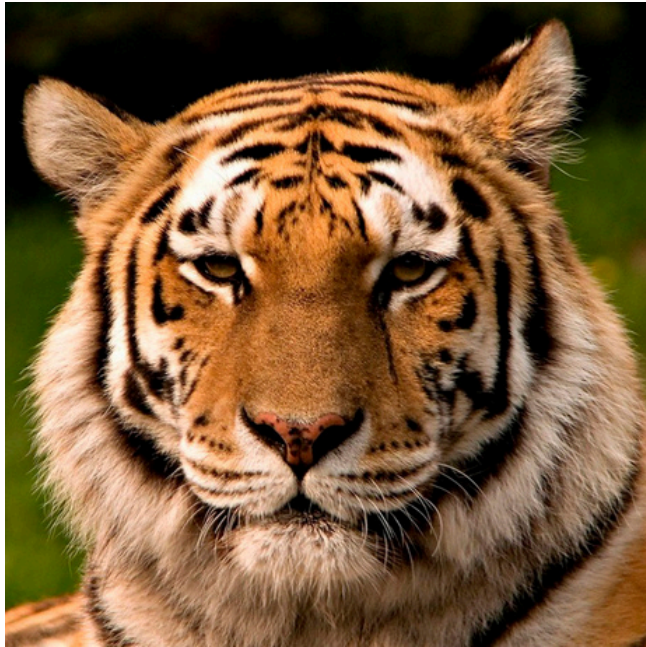
Tigre de base

Premier croquis du logo: un tigre de profil avec l'air arrondie pour donner ce sentiment de sécurité à la marque.